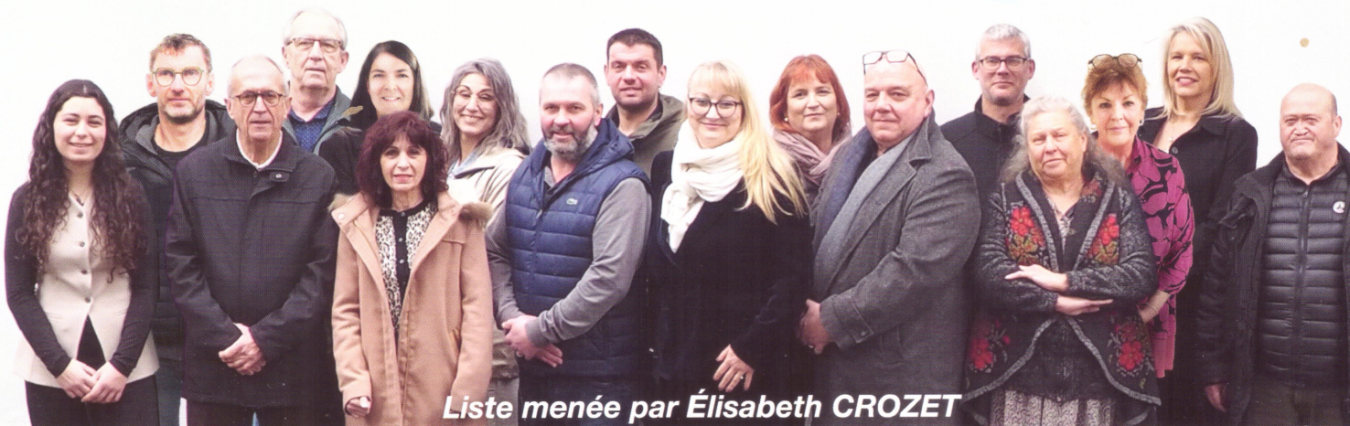
Liste menée par Élisabeth CROZET

Réunion publique le 11 mars salle du casino 19h